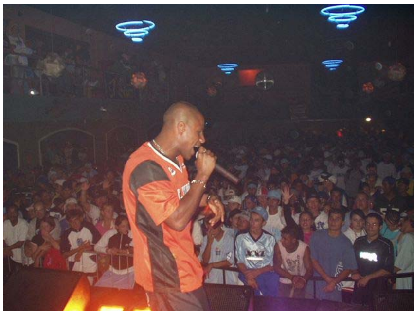
SNIPER em Curitiba – mais de 2000 pessoas

2008: Faz vários shows por toda grande São Paulo e em outros estados como Curitiba, Belo Horizonte, Salvador, Cuiabá, Porto Alegre, Brasília e Rio de Janeiro.